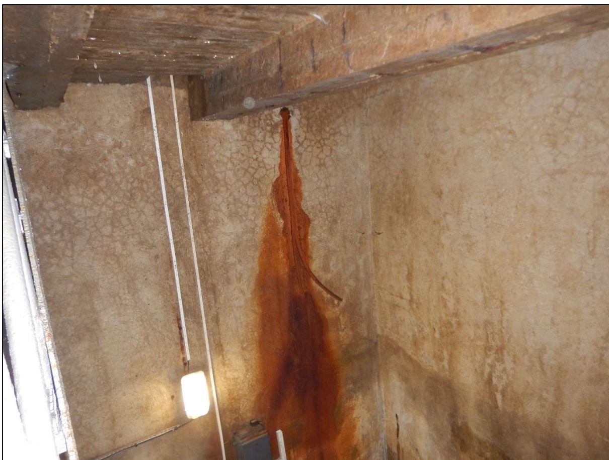
Obr. 8: Vývody nefunkčních tlakoměrných sond v tělese hráze, závady vlivem průsaků a zatékání do šachty – odřezat, bet. povrch sanovat