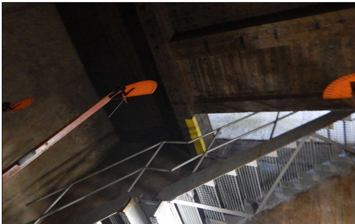
Obr. 7: Snížená podchodná výška stáv. schodiště – závada bude rekonstrukcí odstraněna