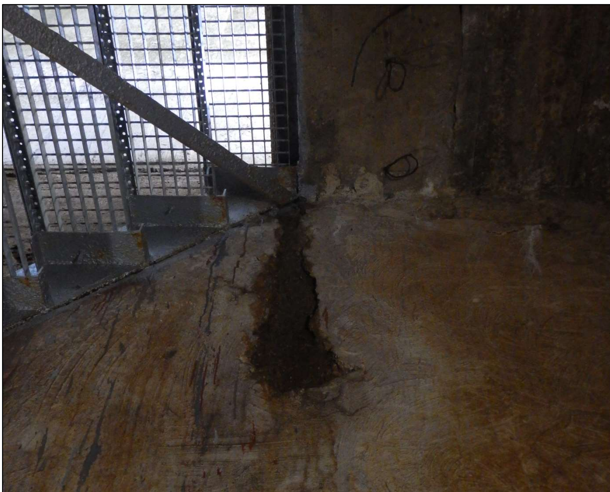
Obr. 9: Kaverna vlivem zatékání odtrženým prahem v 1NP