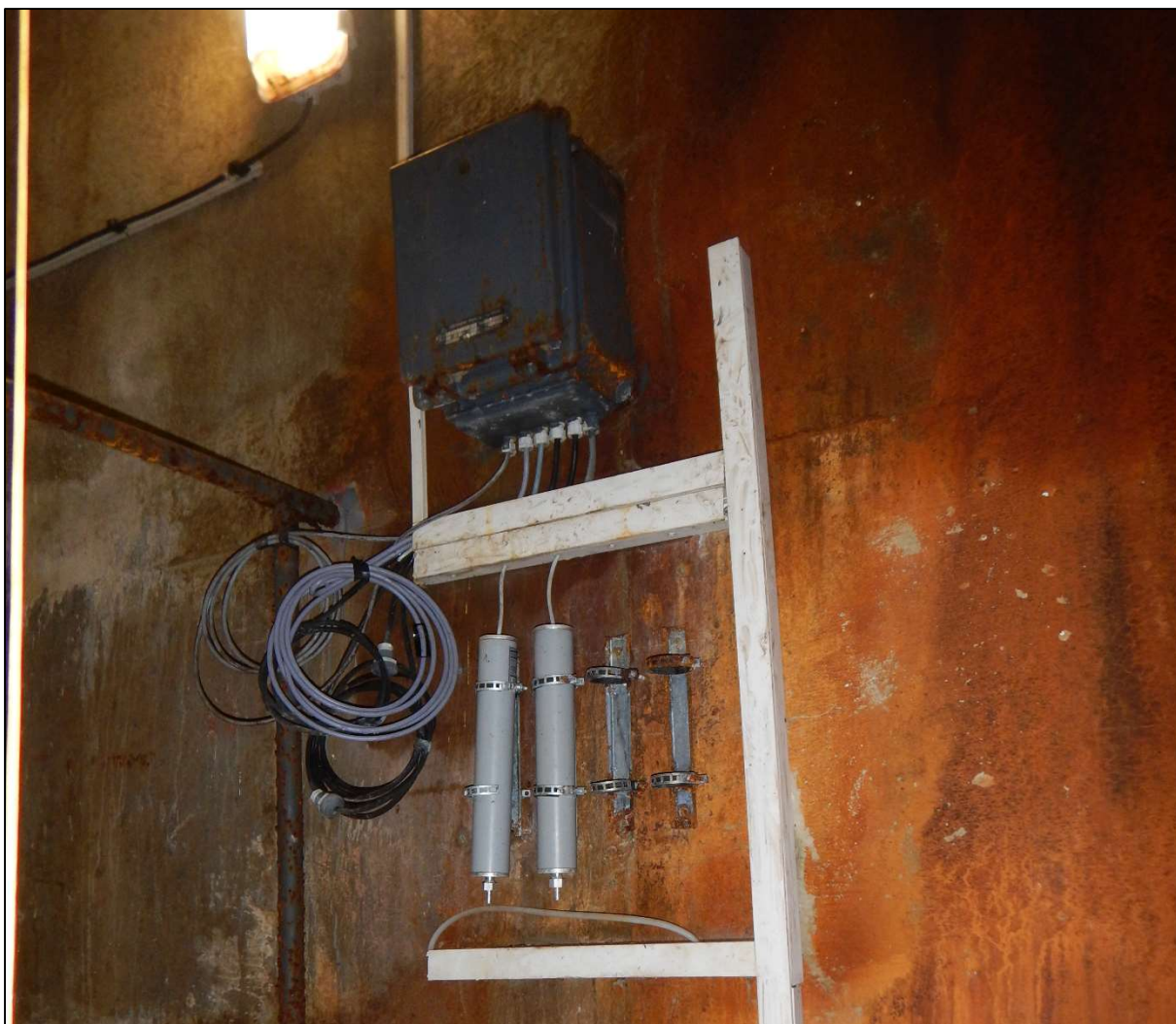
Obr. 5: Stávající rozváděč a přepětová ochrana čiděl hladinoměrů v 1PP