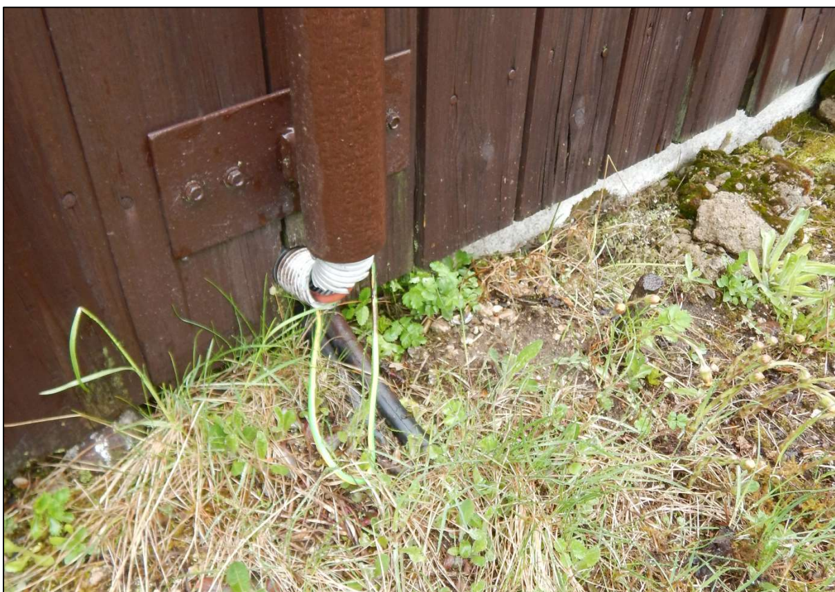
Obr. 2: Vnější vstup el. NN a sděl. kabelu – nezabezpečený, nově bude osazen do nerezové chráničky