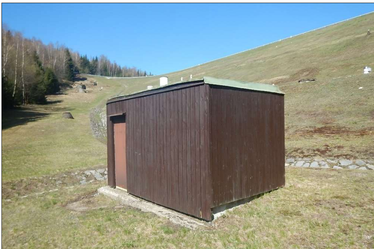
Obr. 1: Celkový pohled na nadzemní část objektu, foto 5/2020