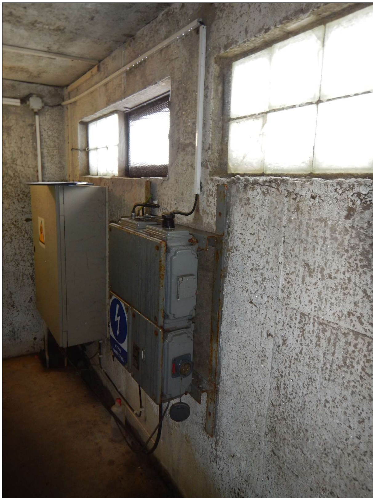
Obr. 3: Stávající umístění rozváděčů v 1NP objektu, interiér 1NP